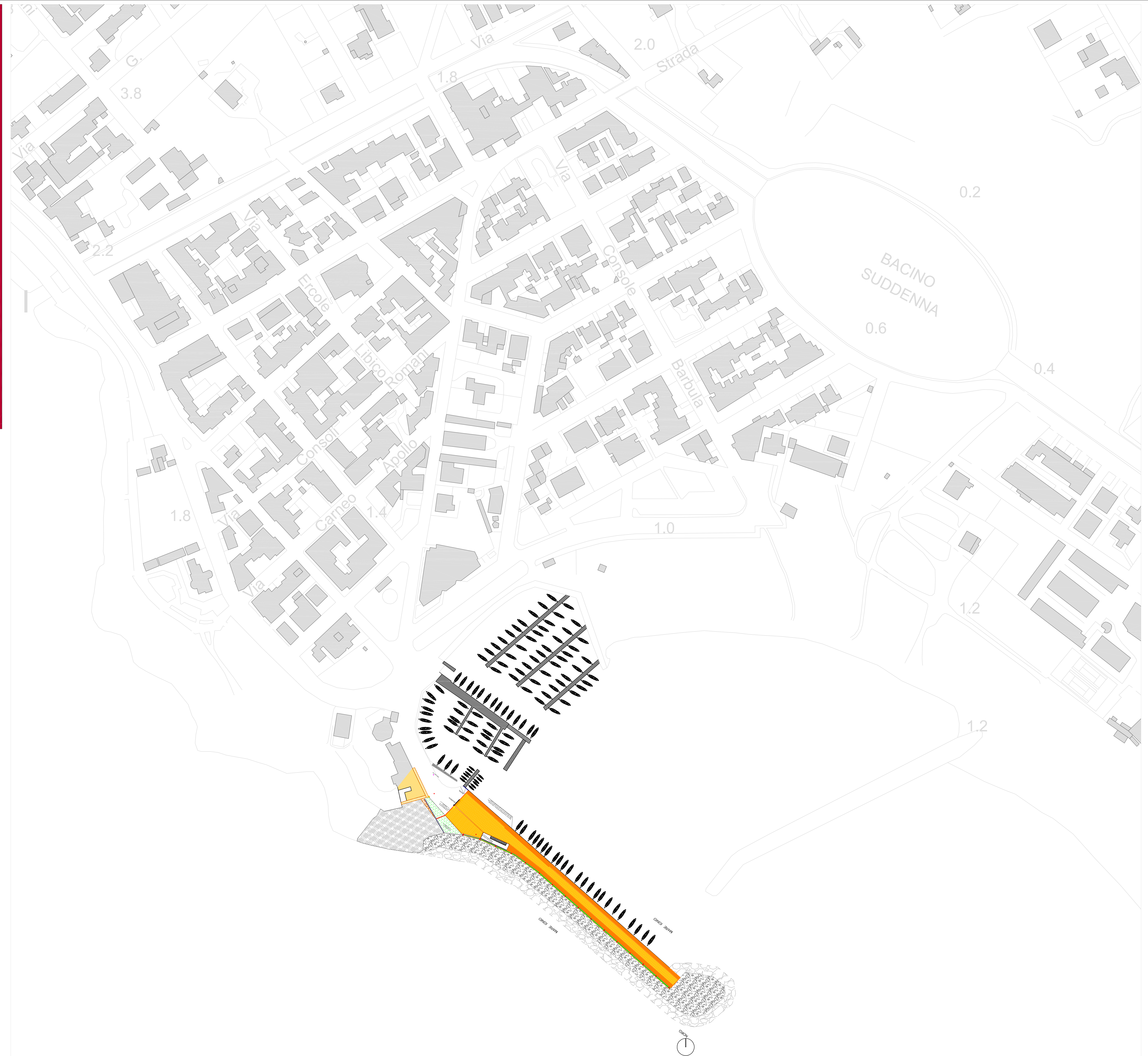
Planimetria del Porto di San Giovanni - Scala 1:1.000