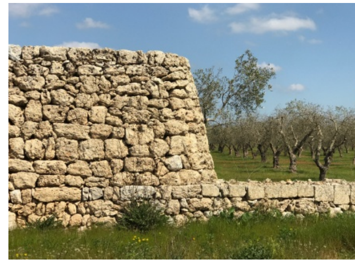
Il paesaggio profondo dell'olivo