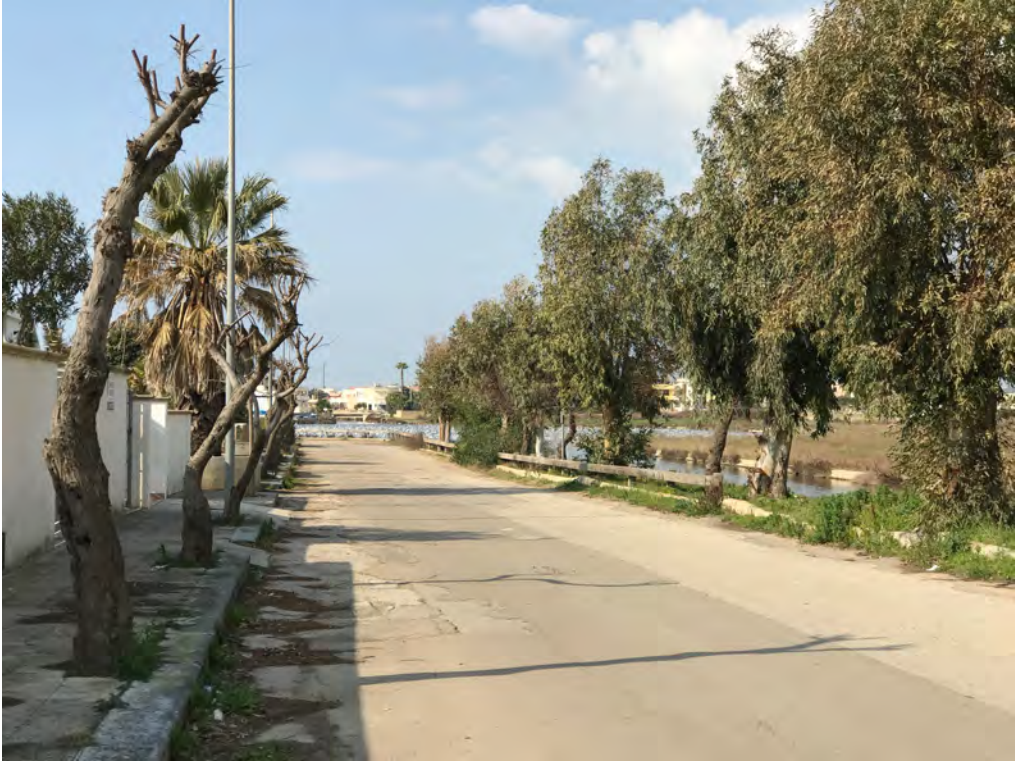
VIALE QUINTO ENNIO