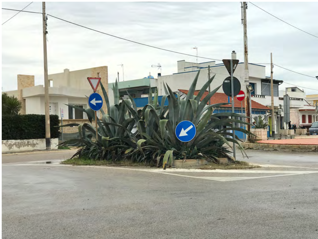
CORSO ANNIBALE, LUNGOMARE JAPIGIA