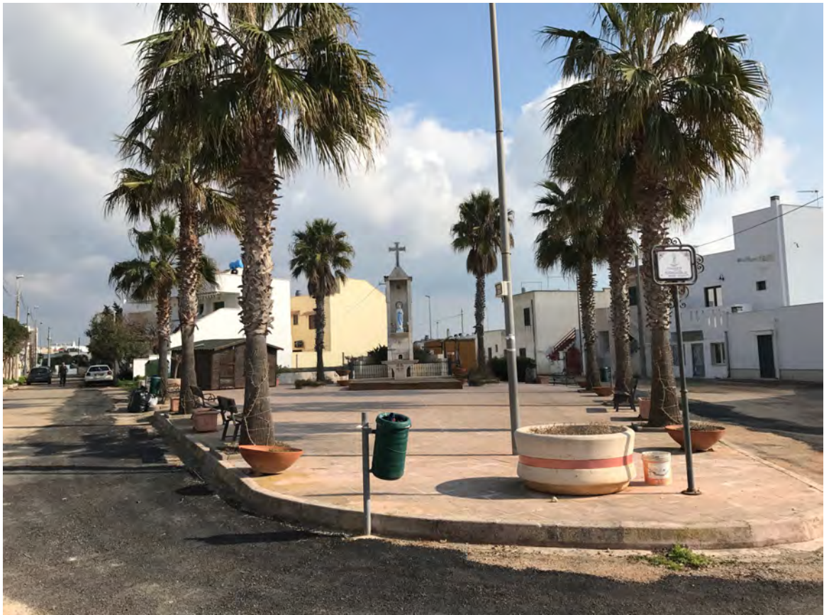
PIAZZETTA MARE VERDE