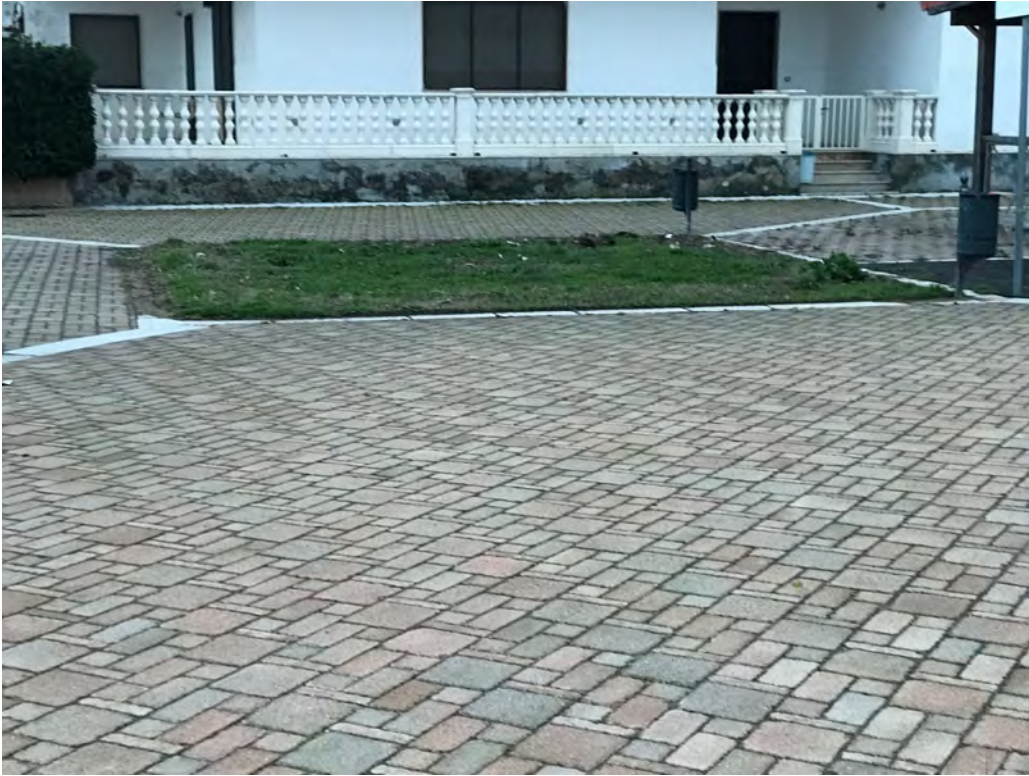
CORSO RE PIRRO