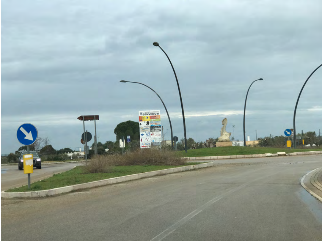
ROTATORIA TORRE SAN GIOVANNI