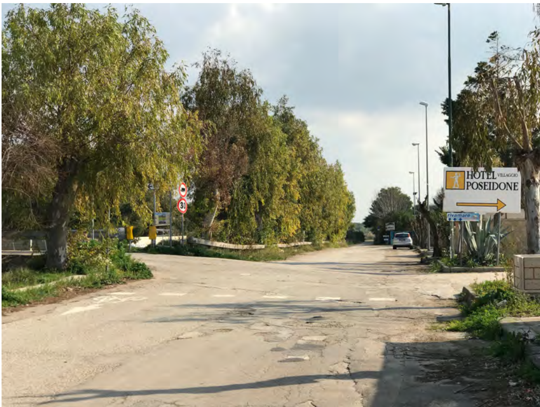
VIALE QUINTO ENNIO