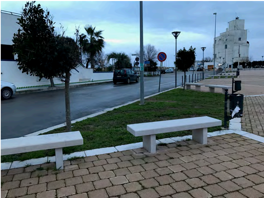
CORSO RE PIRRO