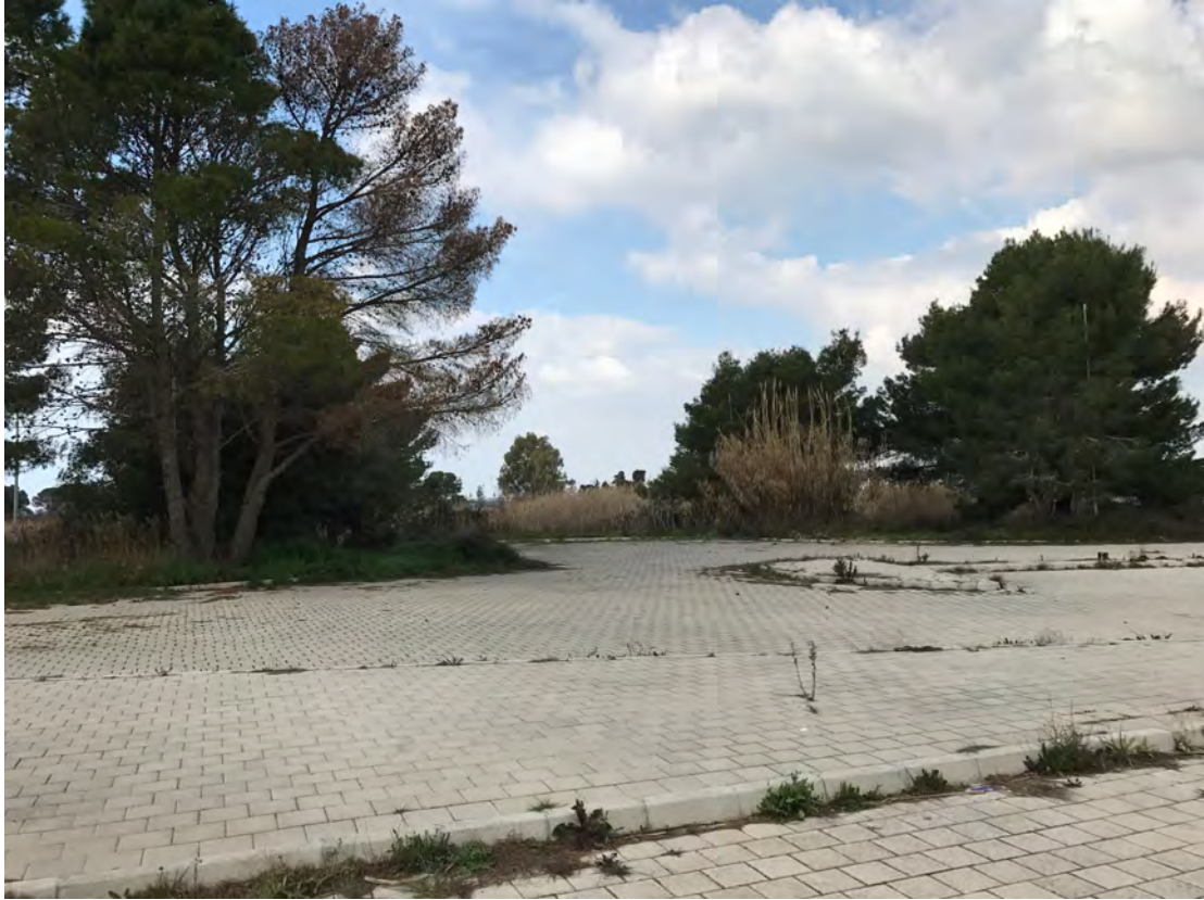
AREA C/O IBERHOTEL