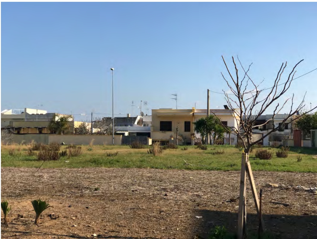
VIALE MONTE SINAI