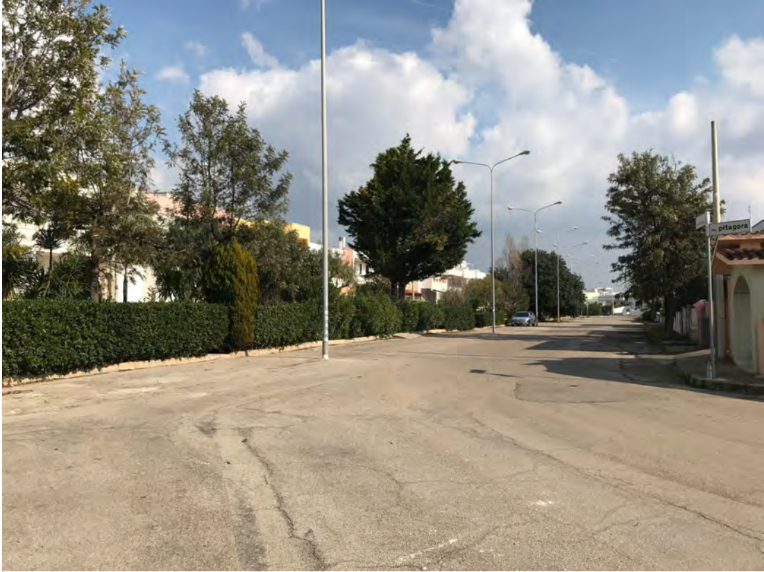
VIALE MONTE BIANCO