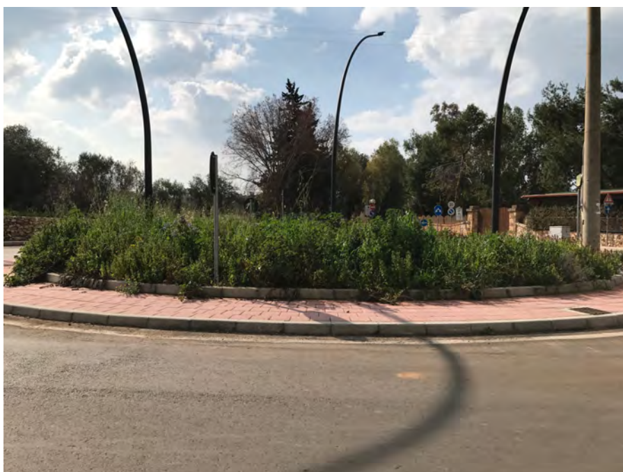
ROTATORIA CAMPING TORRE SAN GIOVANNI