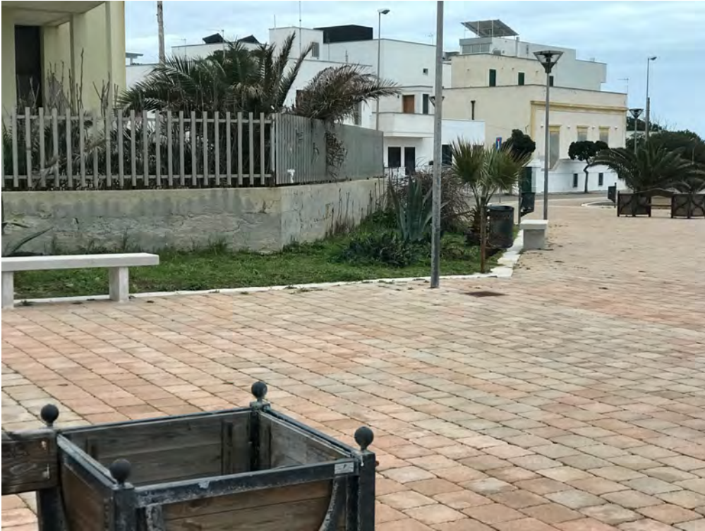
CAPITANERIA DI PORTO