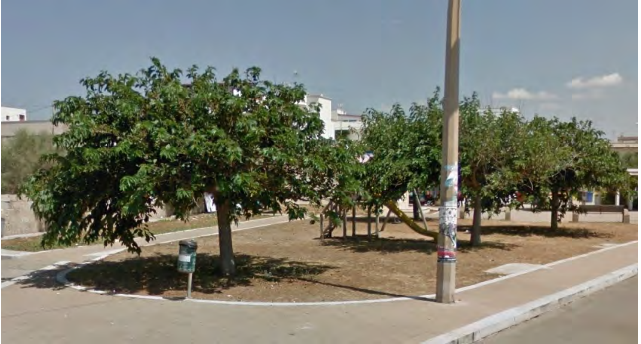
CORSO ANNIBALE, LUNGOMARE JAPIGIA