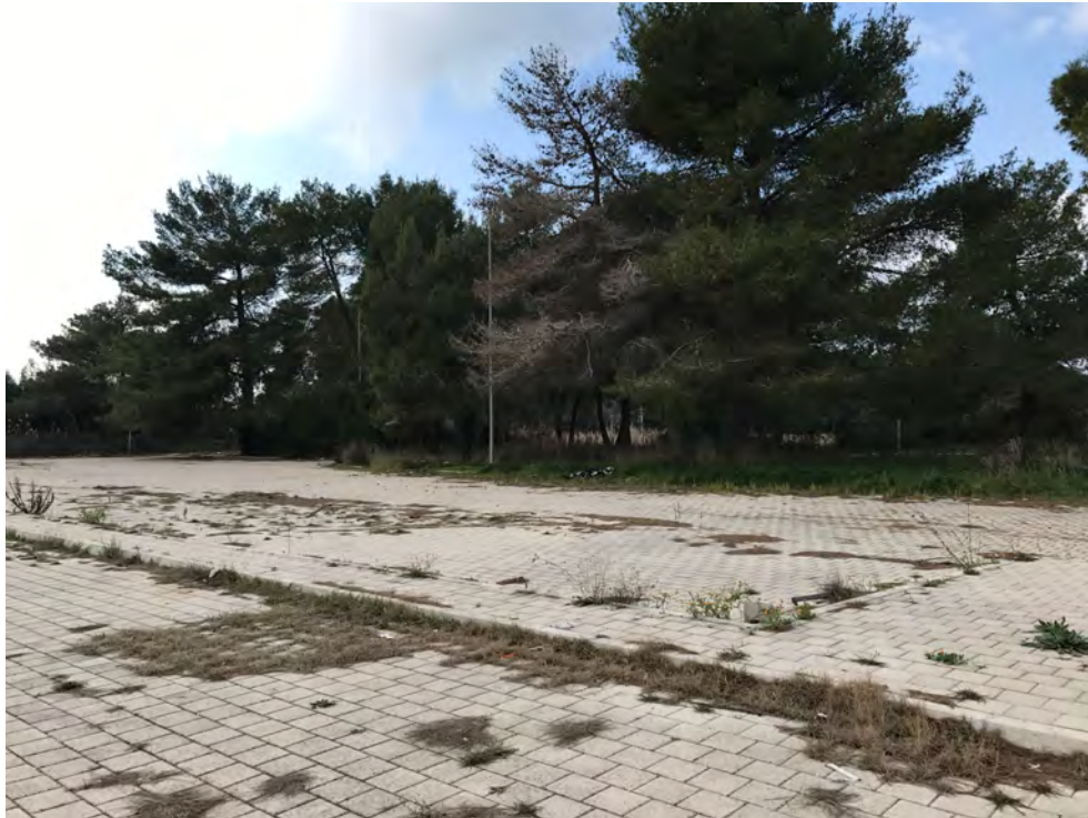
PARCHEGGI DI VIALE VITTORIA TORRE SANGIOVANNI