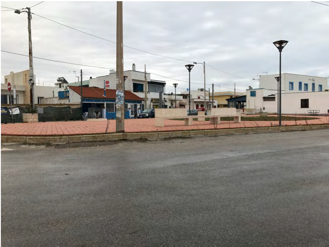
CORSO ANNIBALE, LUNGOMARE JAPIGIA