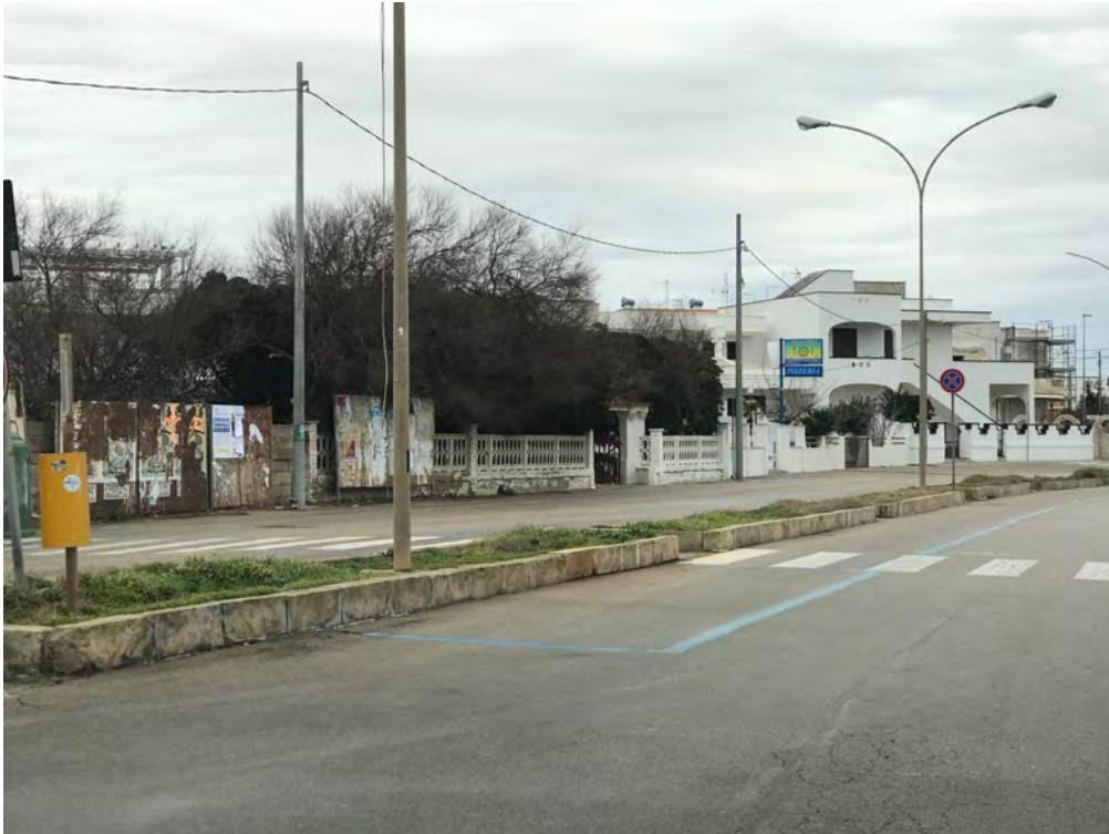
CORSO ANNIBALE, LUNGOMARE JAPIGIA