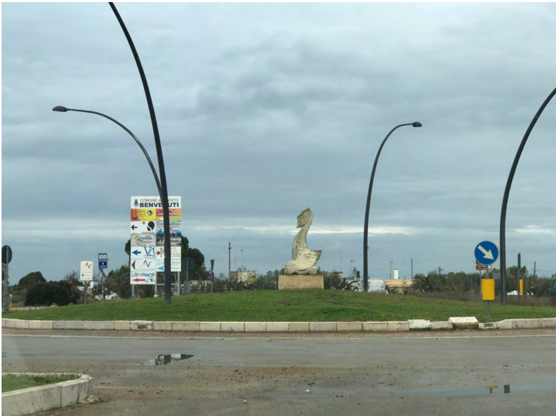
ROTATORIA TORRE SAN GIOVANNI