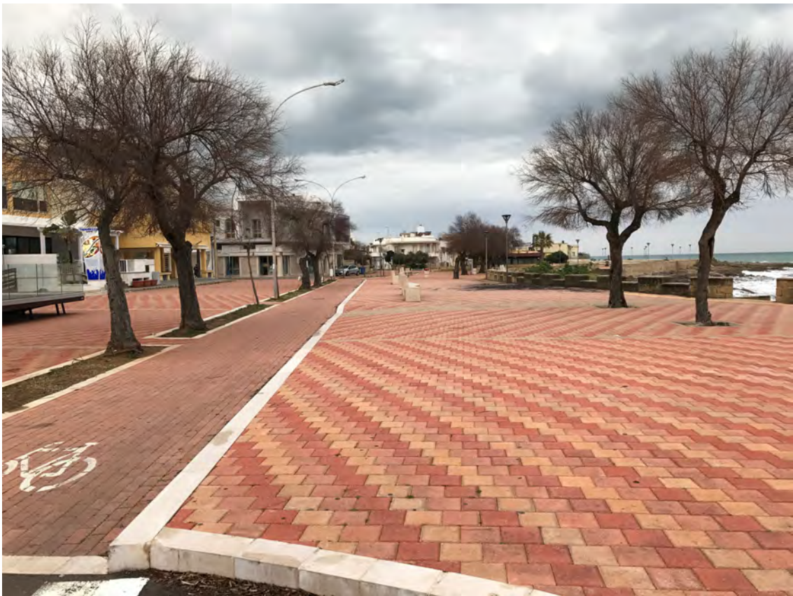
CORSO ANNIBALE, LUNGOMARE JAPIGIA