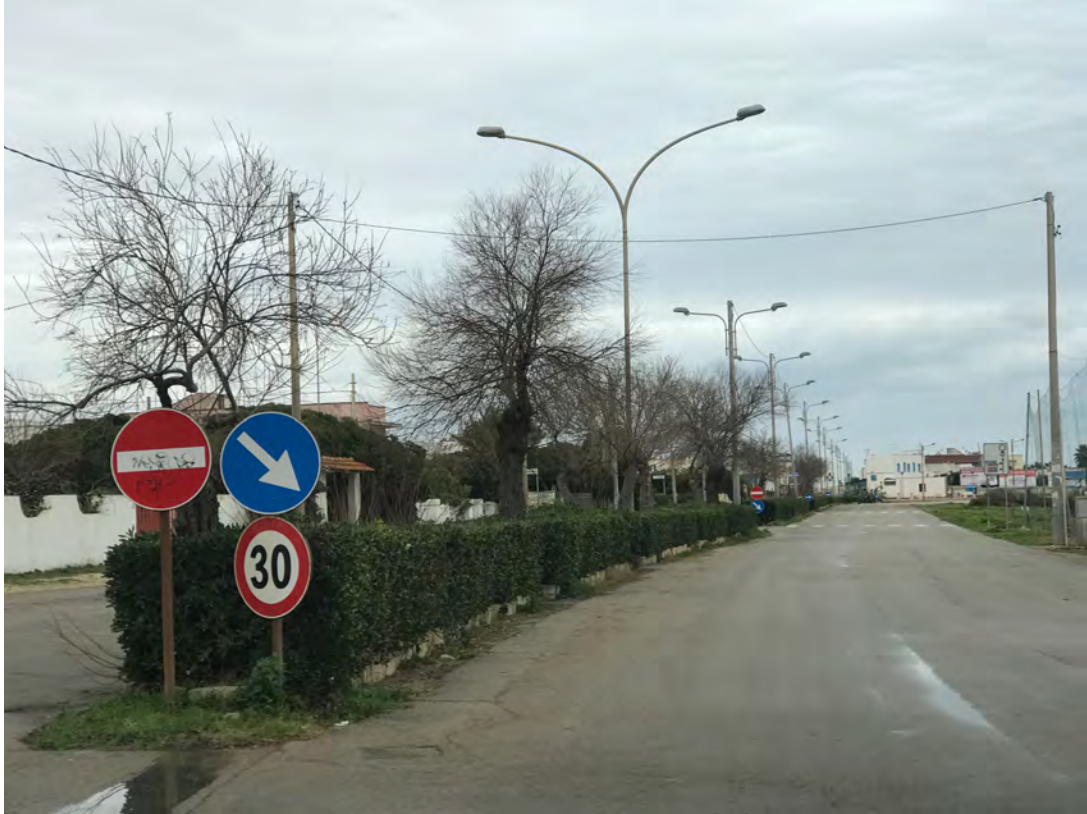
CORSO ANNIBALE, LUNGOMARE JAPIGIA