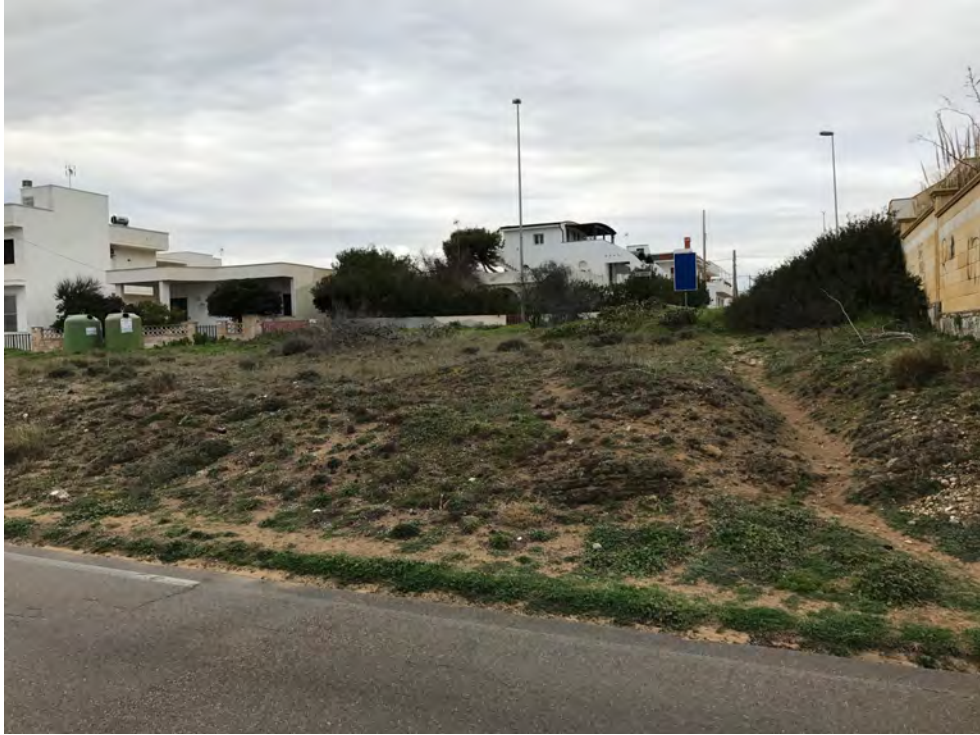
ISOLA DI PAZZE