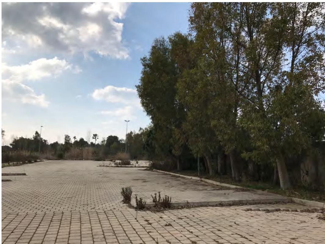
PARCHEGGI DI VIALE VITTORIA TORRE SANGIOVANNI