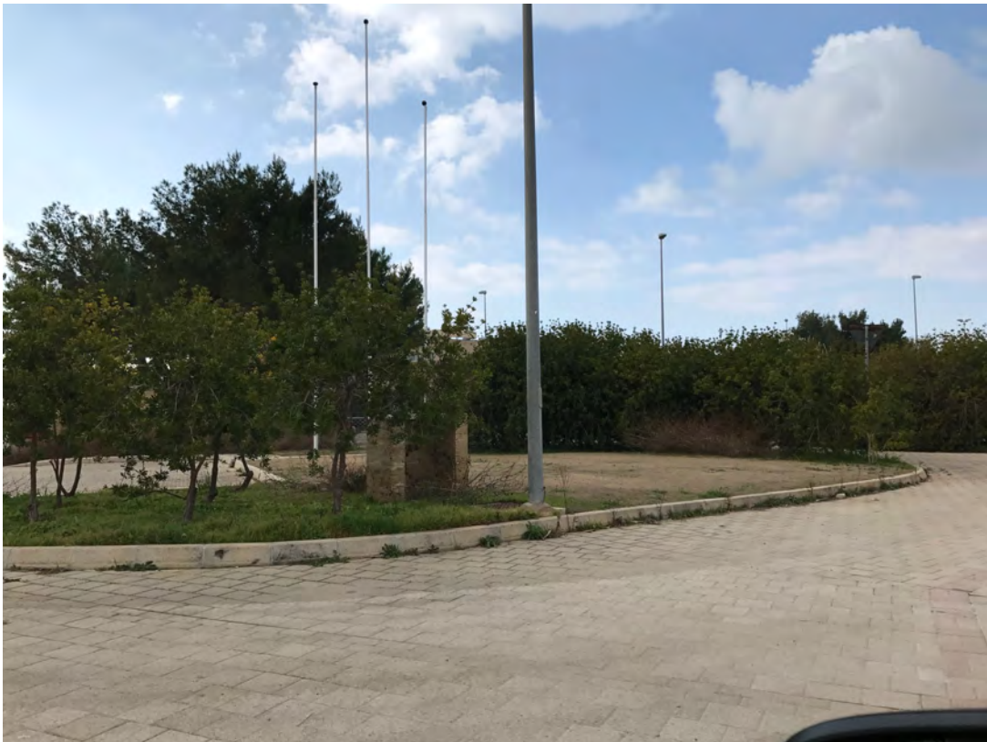
AREA C/O IBERHOTEL