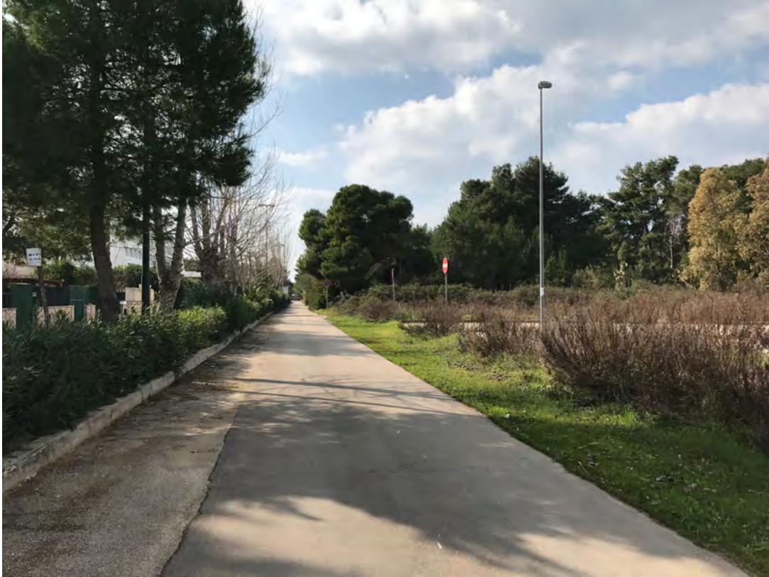
VIA VERSILIA TORRE SAN GIOVANNI