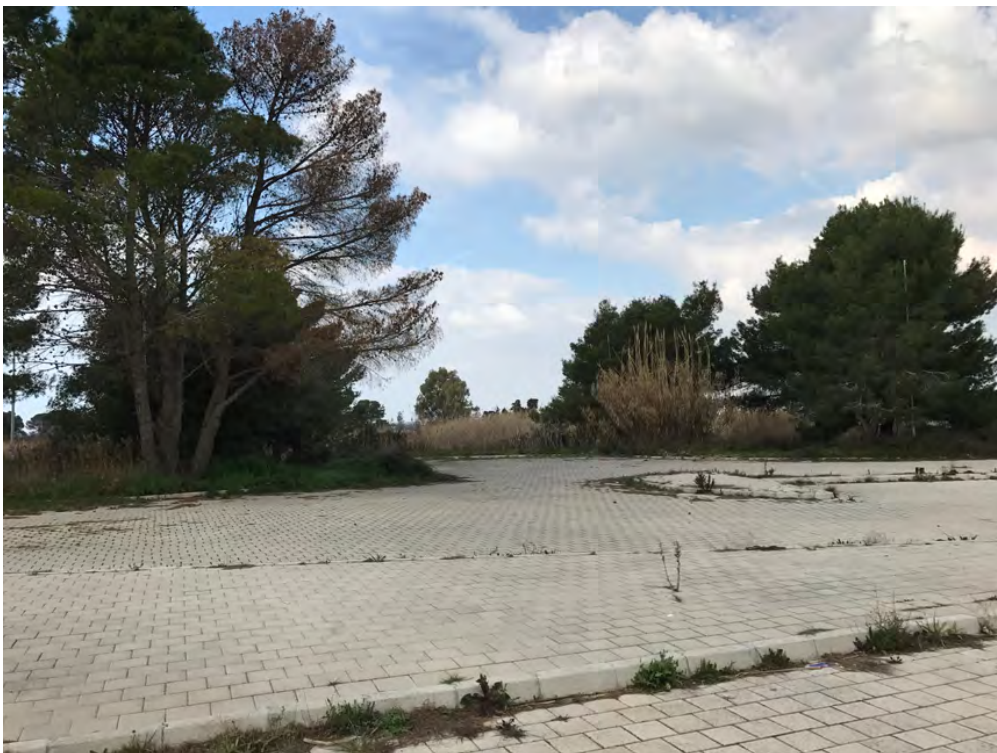
PARCHEGGI DI VIALE VITTORIA TORRE SANGIOVANNI