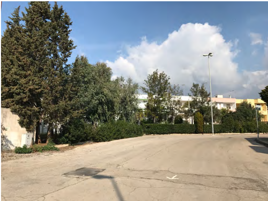
VIALE MONTE BIANCO