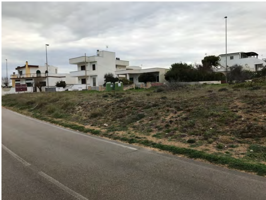
ISOLA DI PAZZE