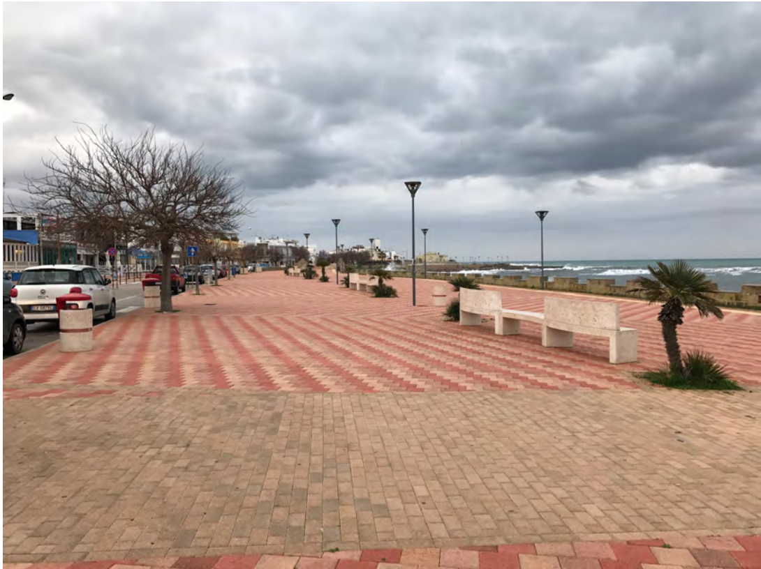
CORSO ANNIBALE, LUNGOMARE JAPIGIA