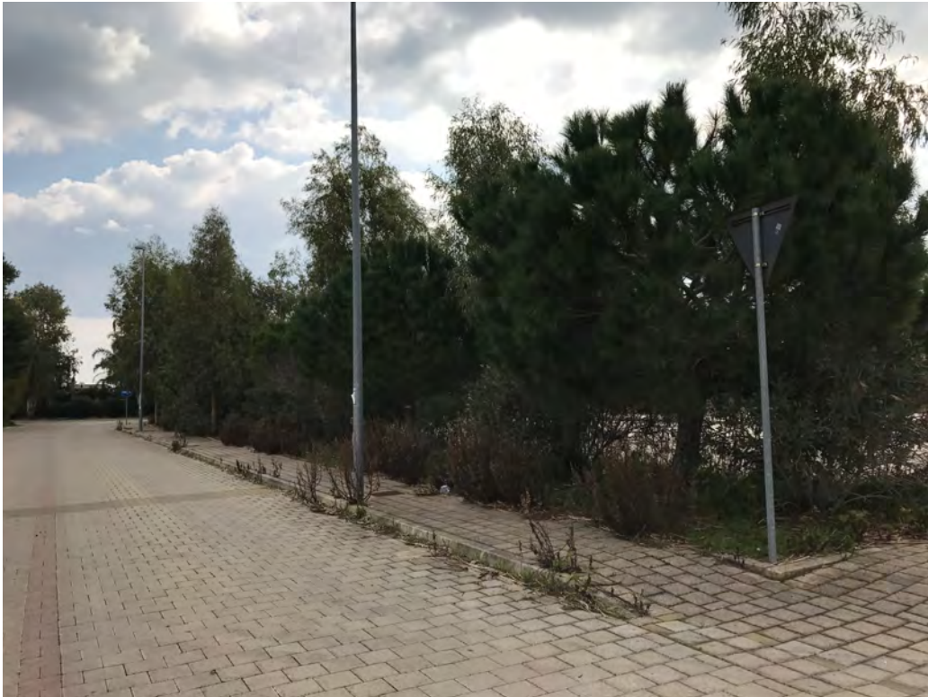
PARCHEGGI DI VIALE VITTORIA TORRE SANGIOVANNI