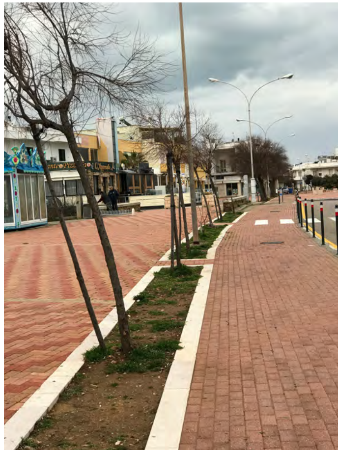
CORSO ANNIBALE, LUNGOMARE JAPIGIA