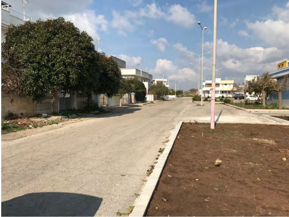
VIALE MONTE EVEREST, VIA COLLEONI