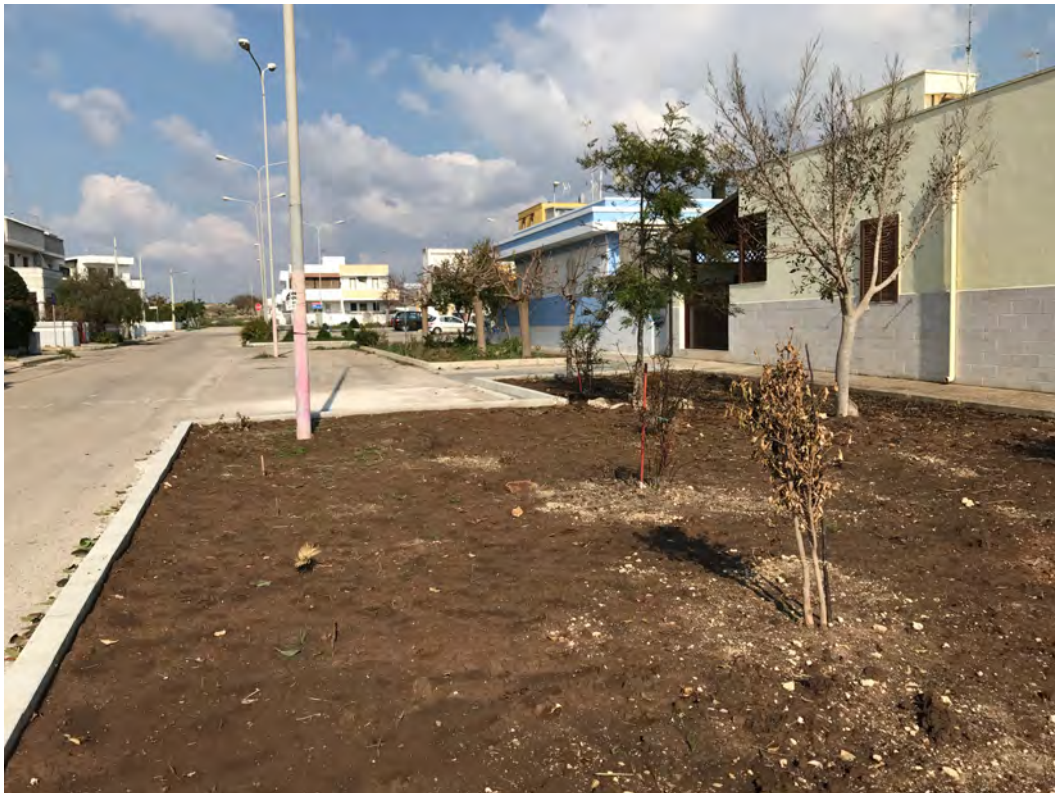
VIALE MONTE EVEREST, VIA COLLEONI