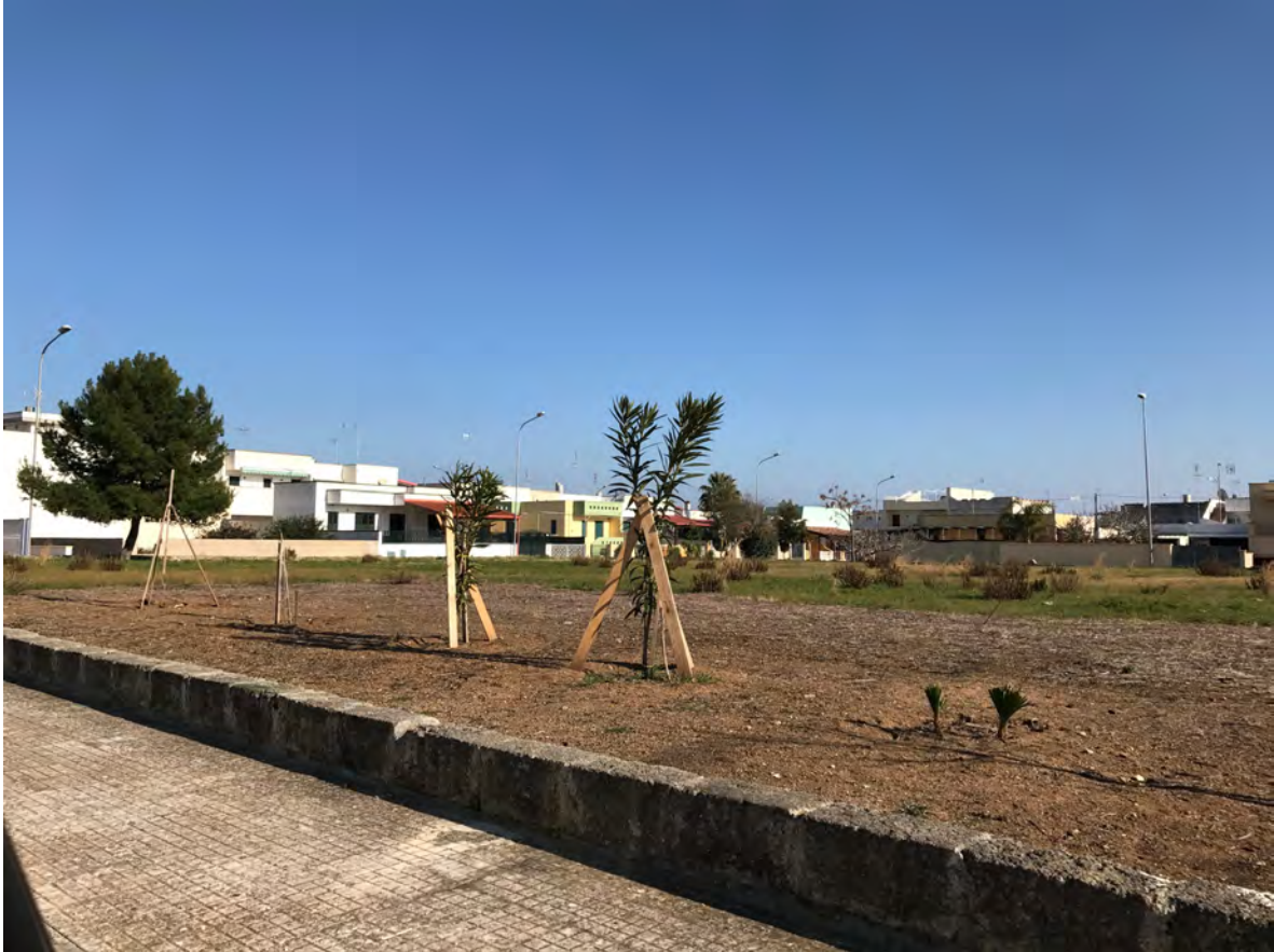
VIALE MONTE SINAI