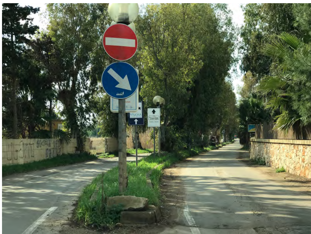
VIALE VITTORIA TORRE SANGIOVANNI