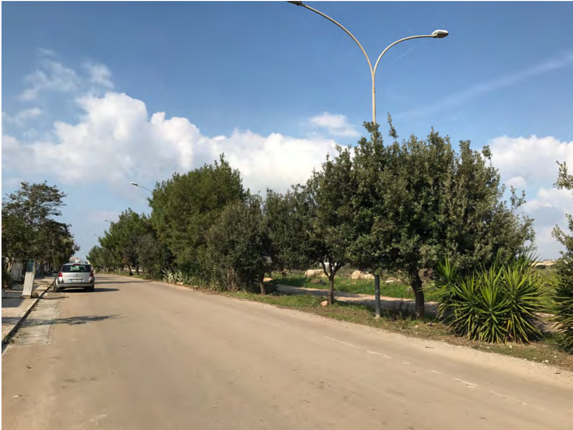
VIALE MONTE POLLINO