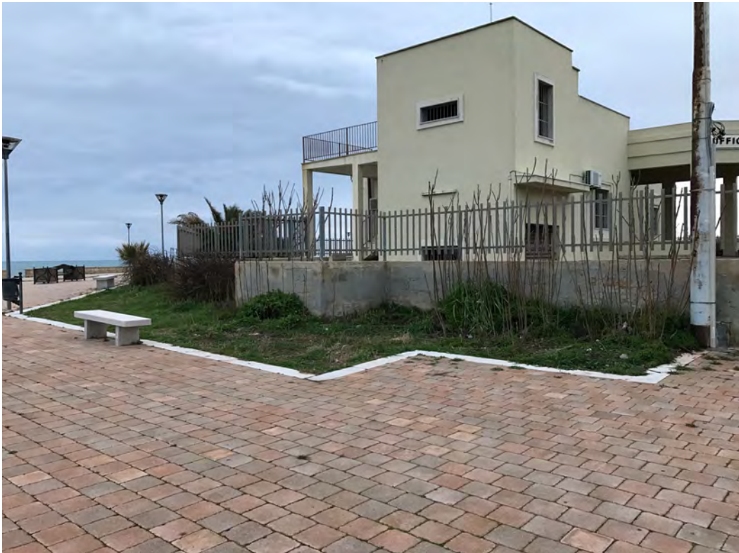
CAPITANERIA DI PORTO