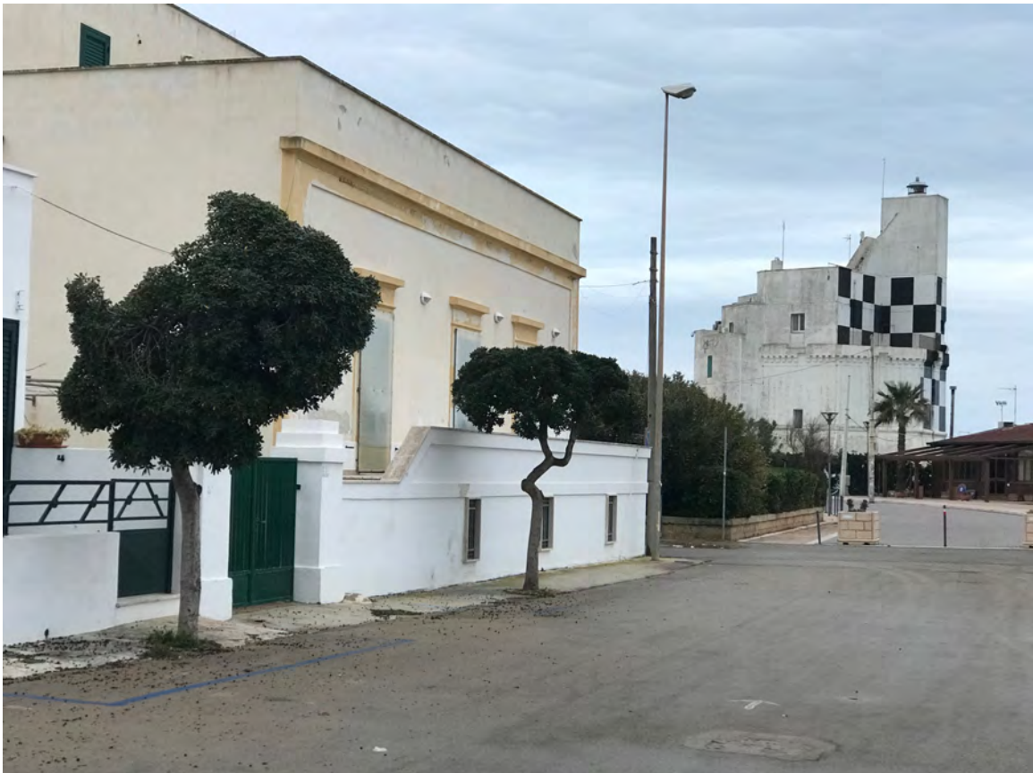
VIA DEA MINERVA