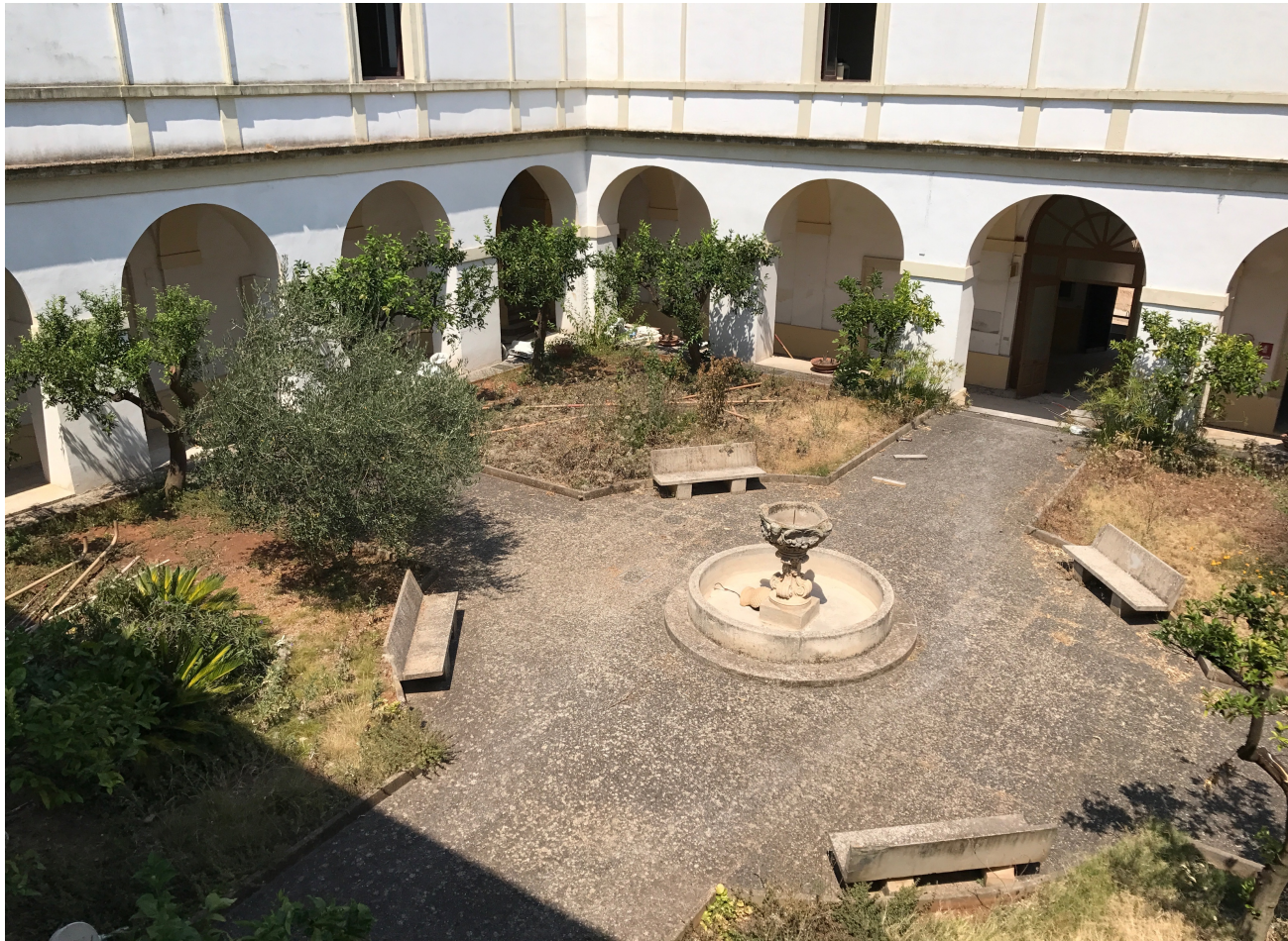
I giardini del Seminario di Ugento. Foto cortili del Vescovado