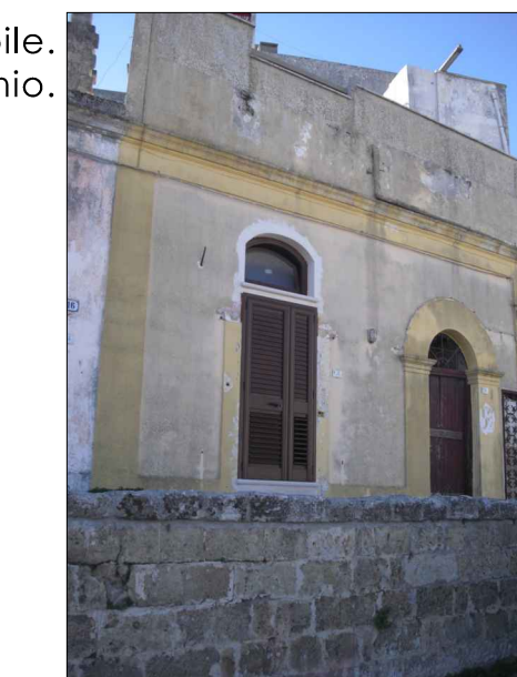
Apertura incompatibile. Persiana in alluminio.