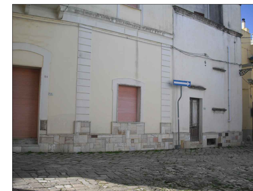
Basamento in marmo incompatibile con altri elementi di facciata.