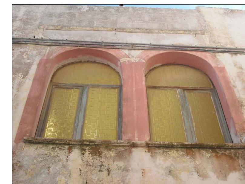
Infissi in alluminio con vetro colorato serigrafato a stampo.