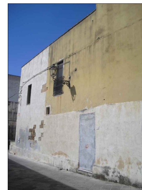
Colorazione secondo criteri della proprietà. Intonacatura a base di cemento.