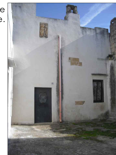
Pluviale in plastica e stonacature.