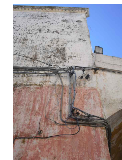
Fili e cavi elettrici a vista.