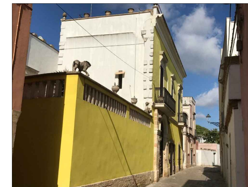
Colorazione dai toni saturi e da tonalità incongrua.