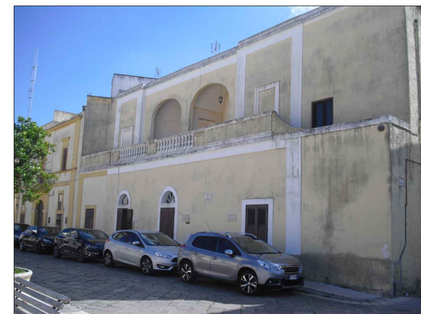
Colorazione secondo criteri della proprietà.

TAV. VII Ugento - Gemini Campionatura elementi "detrattori estetici" area 1