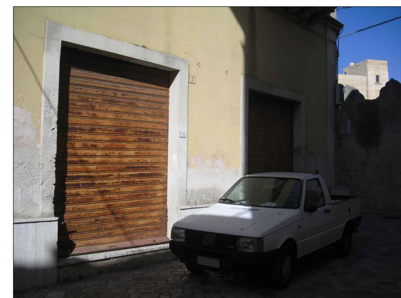
Saracinesche in fasce metalliche.