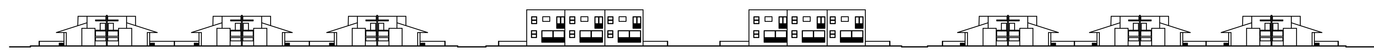
profilo X - X