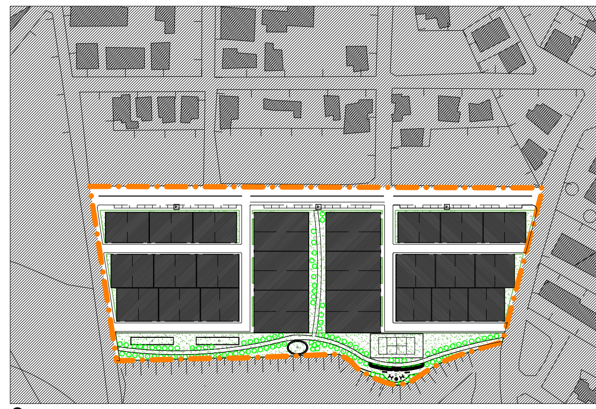
TIPOLOGIE E PROFILI

PIANO URBANISTICO ESECUTIVO DEL COMPARTO 26/A