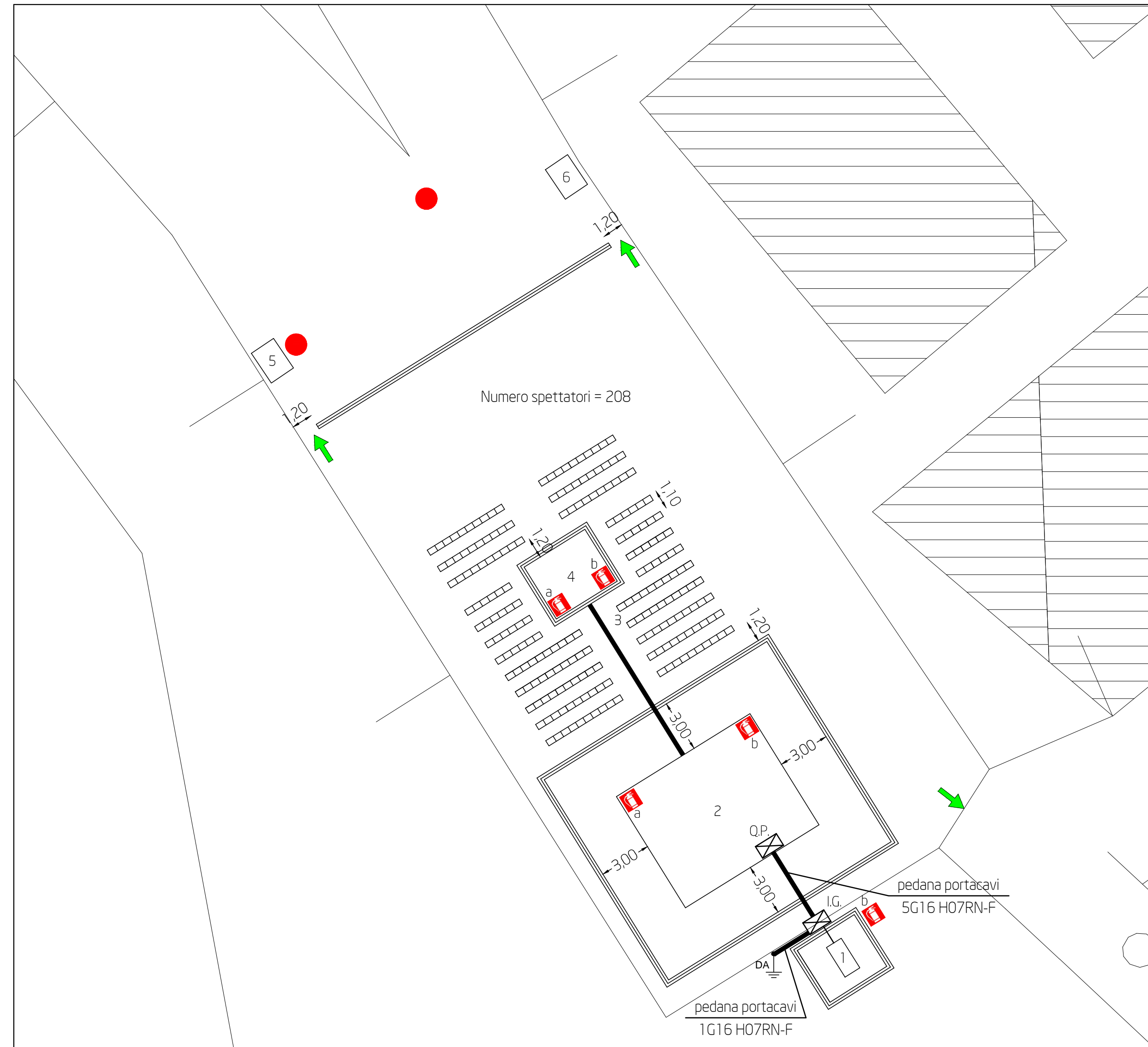
Planimetria scala 1:200