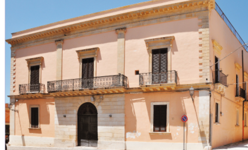
Palazzo Rovito, Corso Umberto I

Per riqualificare la piazza prospiciente il Porto di Torre San Giovanni è stato realizzato un progetto di studio preliminare. I lavori, dell'importo di € 129.114,00, cominceranno presumibilmente dopo l'estate. Si sta redigendo, infatti, la progettazione esecutiva che vedrà un allestimento innovativo della piazza, con una fontana e una pavimentazione adeguate alla località marina.