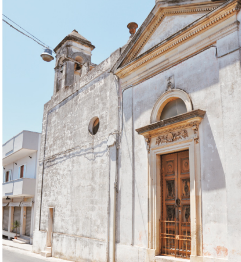
Chiesa Madonna del Rosario, via Mare

Il progetto di restauro è stato redatto con l'obiettivo di non modificare l'iconografia originale dell'edificio e facendo attenzione a non alterare gli aspetti più importanti che la caratterizzano.