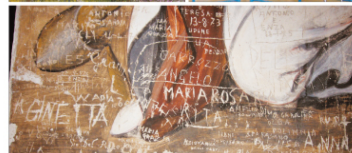
Chiesa Madonna della Luce: facciata esterna, lavori all'interno, particolare di un affresco