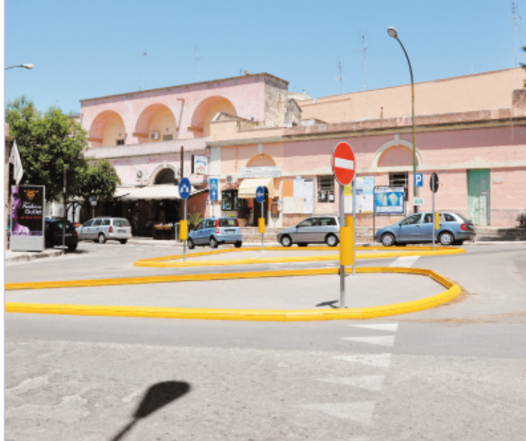
Piazza Porta San Nicola

Iscriviti alla Newsletter inviando una mail a: ausentum@comune.ugento.le.it