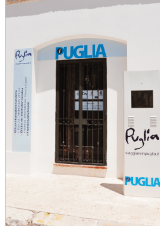
IAT, piazza Adolfo Colosso

Ausentum L'informazione al cittadino Trimestrale istituzionale della Città di Ugento