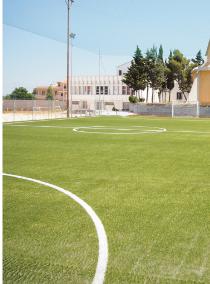
Campo di calcetto presso il Sacro Cuore

Una nuova struttura a servizio dello sport ugentino sarà inaugurata il 14 giugno prossimo. Si tratta di un campo di calcetto, dedicato a Papa Benedetto XVI, costruito presso la parrocchia "Sacro Cuore di Gesù". La struttura è stata realizzata grazie ad un contributo di € 84.978,00 riconosciuto alla parrocchia dall'Assessorato alla Trasparenza e alla Cittadinanza Attiva - Settore Politiche Giovanili e Sport della Regione Puglia. Il progetto ha ricevuto parere favorevole del CONI e ha rispettato le normative in vigore per le strutture sportive. Il campo è in erba sintetica e l'area di gioco, 42 metri per 23, è recitata e circondata da camminamenti. Il progetto prevede anche una imminente ristrutturazione degli spogliatoi già esistenti. Per poter accedere ai contributi per la realizzazione di strutture sportive, così come previsto dalla legge regionale n. 32 del 1985, il 3 marzo scorso il Comune di Ugento e la parrocchia "Sacro Cuore di Gesù" hanno sottoscritto una convenzione diretta a garantire l'uso sociale dell'impianto. L'accordo prevede che per 15 anni il Comune potrà utilizzare gli impianti, partecipando alla loro manutenzione e salvaguardia, tramite la costituzione di un comitato di gestione. L'utilizzo degli impianti sarà garantito a tutti i cittadini, le associazioni ricreative e sportive e i gruppi scolastici, anche a pagamento. Il 7 giugno scorso è stato inaugurato, presso la stessa parrocchia, un parco giochi per bambini intitolato a Papa Giovanni Paolo II.